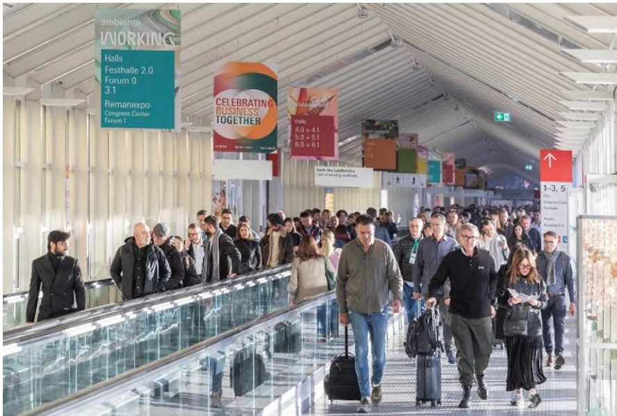
Ambiente、Christmasworld 和 Creativeworld 三大展联袂呈现了一场全球消费品行业的盛大聚会

法兰克福，2024 年 1 月 30 日。2024 年，全球消费品行业年度盛事再度启幕，法兰克福展览集团旗下三大领先消费品展：法兰克福国际春季消费品展览会（Ambiente）、法兰克福国际圣诞礼品世界博览会（Christmasworld）和法兰克福 DIY 手工制作及创意文具展览会（Creativeworld）以“共襄商业盛典（Celebrating Business Together）”为主旨，共同构筑起规模空前的国际消费品贸易平台。此次展会创下多项历史记录：参展商数量较上届增长 10%，共有 4,928 家展商在超过 36 万平方米的展出面积上展示了他们的最新产品。尽管受到数日铁路罢工的影响，这场在法兰克福展览中心有史以来规模最大的展会，依然凭借其呈现的丰富趋势和创新内容，吸引了约 14 万名来自各行各业和不同销售渠道的专业观众。作为消费品行业的国际交流和商贸平台，该展会汇集了超过 170 个国家和地区的观众，针对当前市场所面临的各项挑战，提供了专业指导、灵感启发以及解决方案。